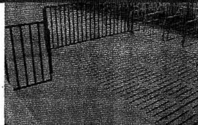
Suelo de hormigón emparrillado y sin emparrillar