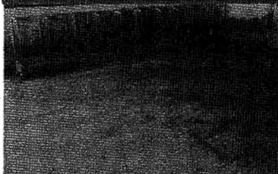
Suelo continuo compacto sin aberturas de drenaje